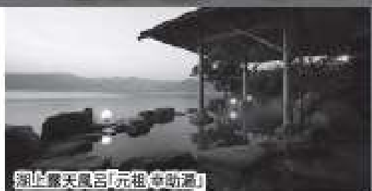
湖上露天風呂「元祖幸助湯」